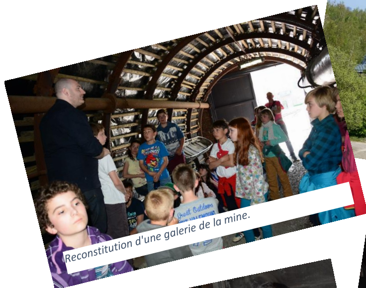
Reconstitution d'une galerie de la mine.

Ce lieu vaut le détour pour réaliser de très belles balades sur les terrils.