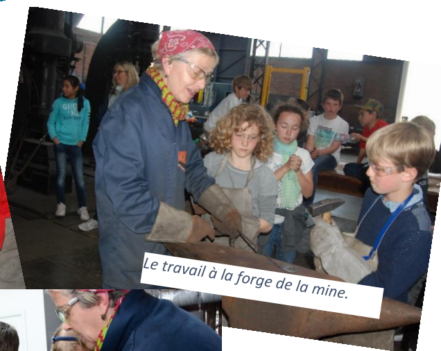
Le travail à la forge de la mine.